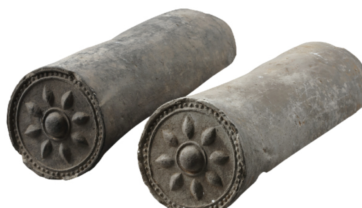
수막새 진도 용장성 | 고려