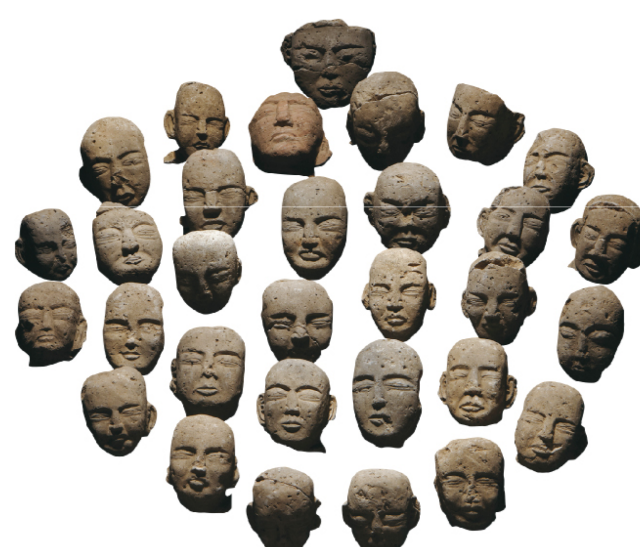
나한상 나주 불회사 | 고려 ~ 조선

영산강은 예로부터 서남해안을 연결하는 중요한 뱃길이었습니다. 통일신라시대 청해진(淸海鎭)에는 중국과 일본을 왕래 하던 배들이 드나들었으며, 고려시대 삼별초(三別抄)는 몽골과의 항쟁을 위하여 진도에 자리 잡기도 하였습니다. 영산강의 중심에 위치한 나주는 뱃길의 중심지로, 많은 물자와 사람들이 모였으며, 뛰어난 학자와 많은 명사들을 배출하였습니다.