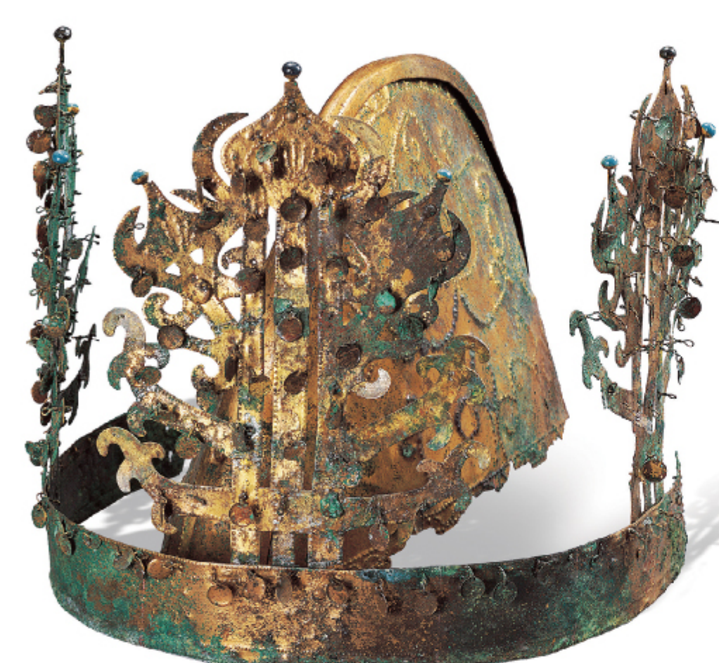
금동관 국보 제296호 | 나주 신촌리 9호분 | 삼국