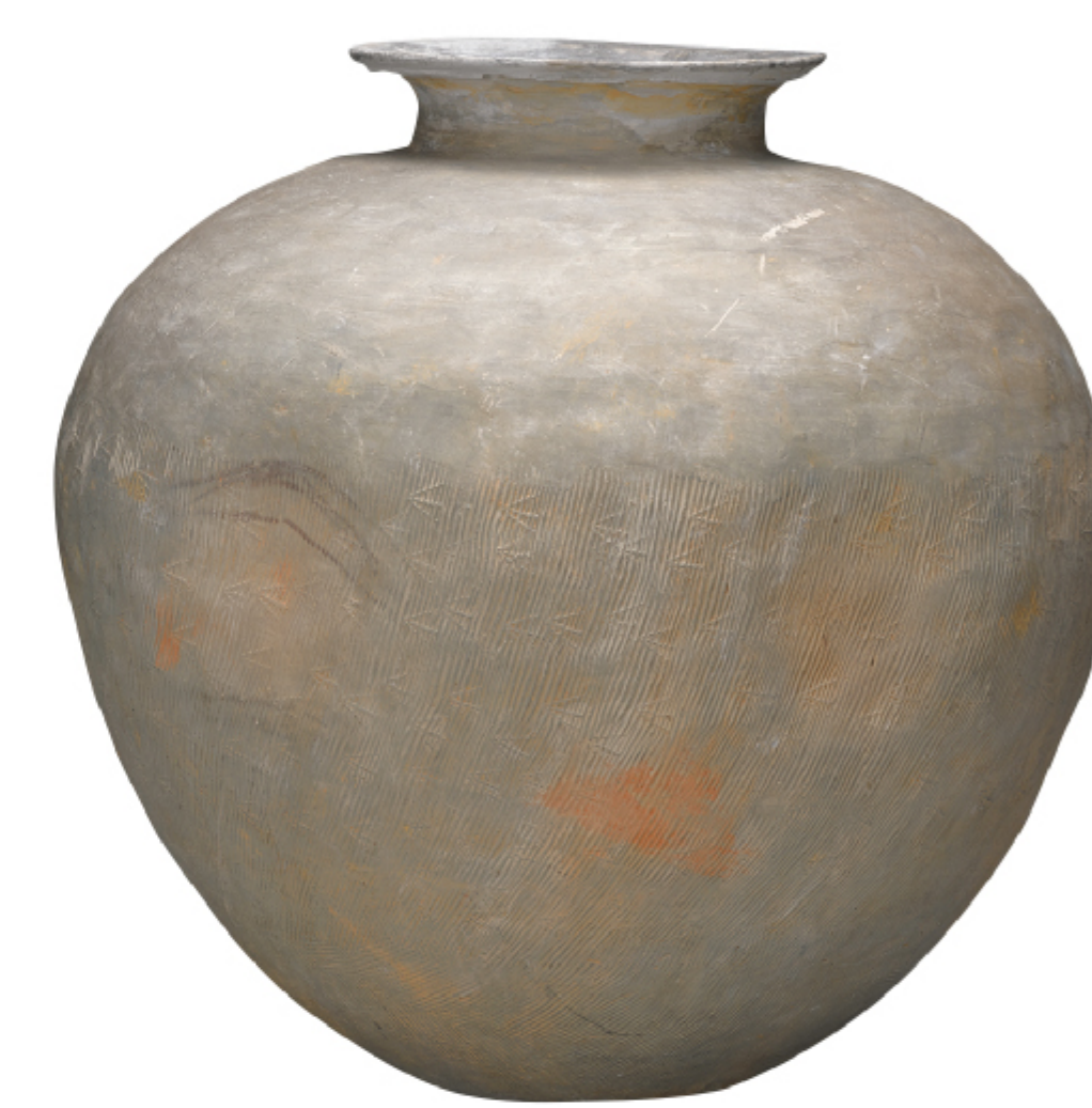
새발무늬항아리 나주 덕산리 4호분 | 삼국