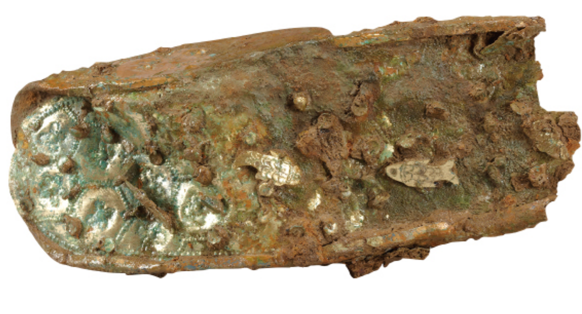
금동신발 나주 북암리 3호분 | 삼국