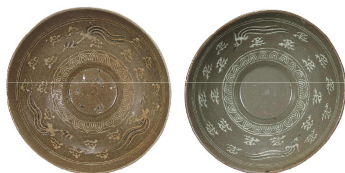
청자구름봉황무늬대접 무안 송석리 도리포 | 고려