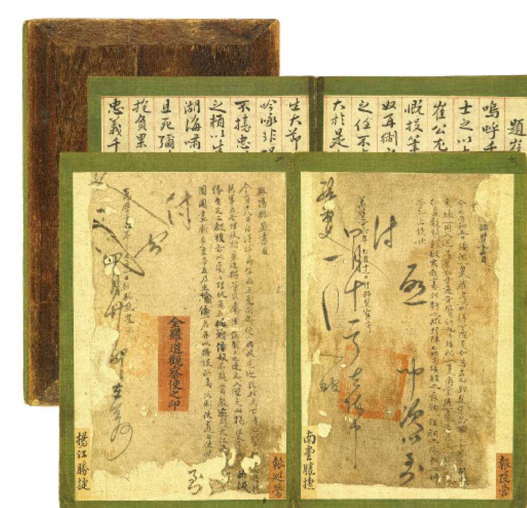
임란첩보서목 보물 제660호 | 최희량(1560~1651) | 1598년 조선