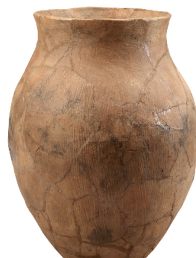
민무늬토기 영암 장천리 | 청동기