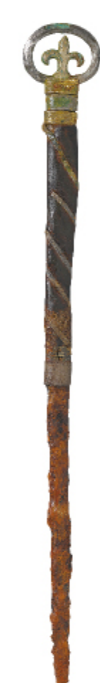
세잎장식 칼 나주 북암리 3호분 | 삼국