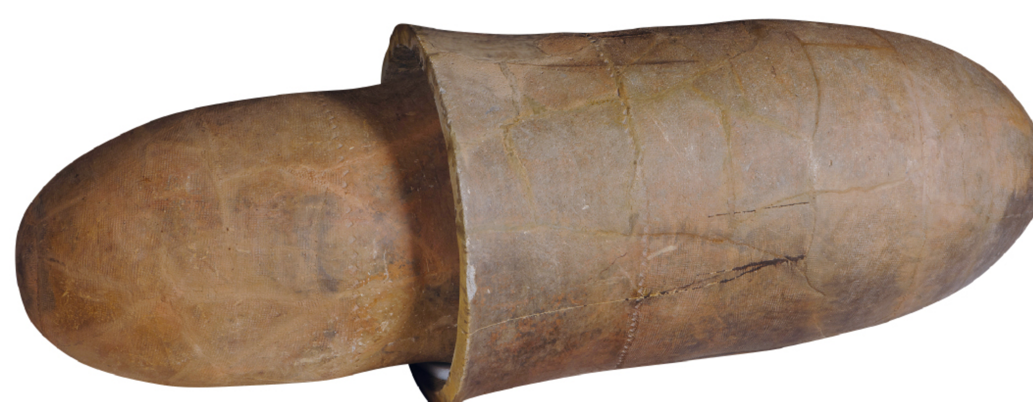
독널 영암 태간리 | 삼국

영산강유역에는 고대인들이 남긴 수백 기의 고분들이 남아 있습니다. 이 무덤에는 독널, 즉 거대한 항아리 2개를 붙여 만든 관이 묻혀 있습니다. 커다란 독널은 다른 지역에서는 찾아볼 수 없는 독특한 문화로, 안에서는 금동관·금동신발·봉황무늬 고리자루칼 등 화려한 유물이 발견됩니다. 영산강유역의 독널무덤은 지역의 독자적 문화를 발전시켰다는 것을 보여줍니다.