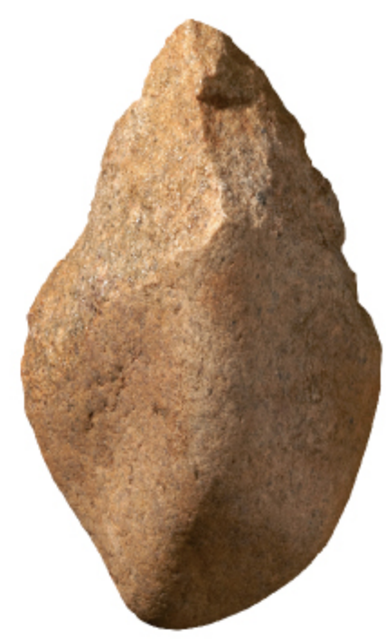
주먹도끼 나주 도만동 | 구석기

전라남도를 가로지르는 영산강은 예로부터 풍요로운 삶의 터전을 제공하여 문화 발전의 바탕이 되었습니다. 영산강유역에 사람들이 자리 잡기 시작한 때는 약 8만 년 전으로, 이후 도구를 만들어 사용하고 풍부한 해양 자원을 활용하기 시작했습니다. 농경이 시작된 청동기시대를 거치며 세력을 키운 여러 집단은 점점 정치적 성격을 지닌 큰 집단으로 성장하게 됩니다.