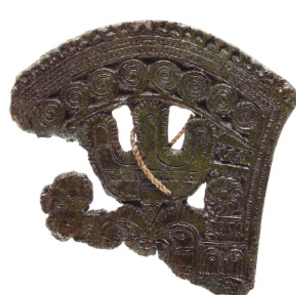
새무늬청동기 영광 화평리 수동 | 마한