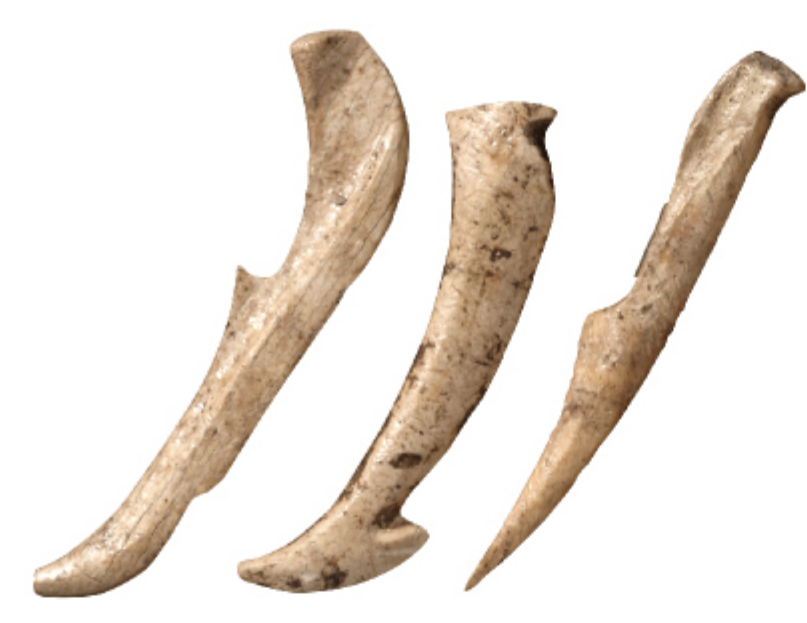
이음뉘시 바늘 완도 여서도 | 신석기