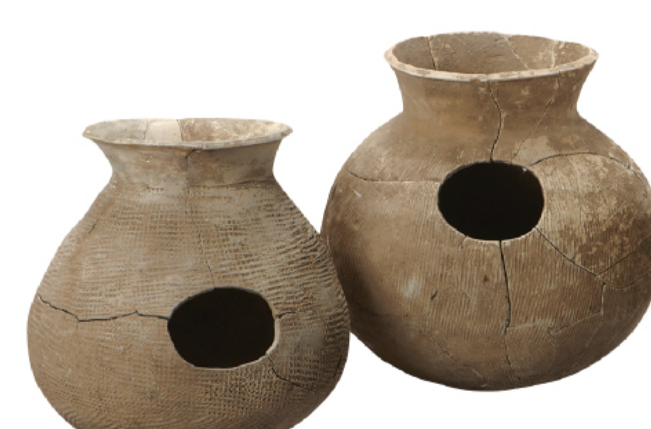
구멍항아리 진도 오산리 | 마한