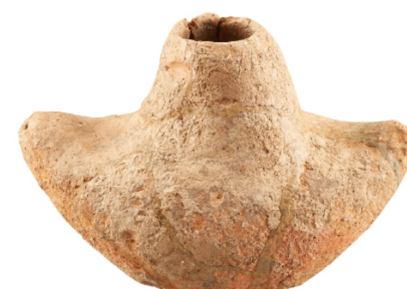
새모양토기 함평 마산리 표산 | 마한