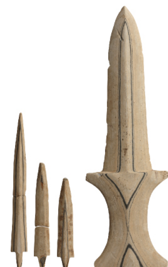
돌화살촉과 간돌검 여수 봉계동 | 청동기