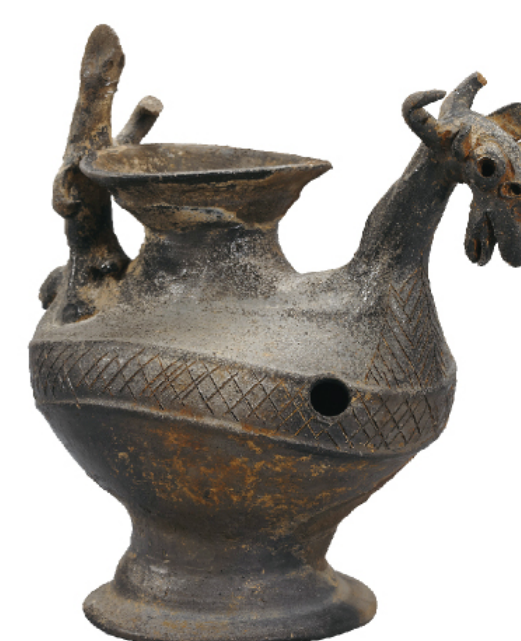
상서로운 동물모양 토기 해남 만의총 1호분 | 삼국