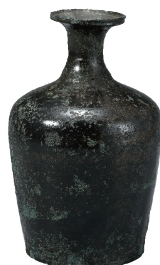
청동병 완도 청해진 | 통일신라