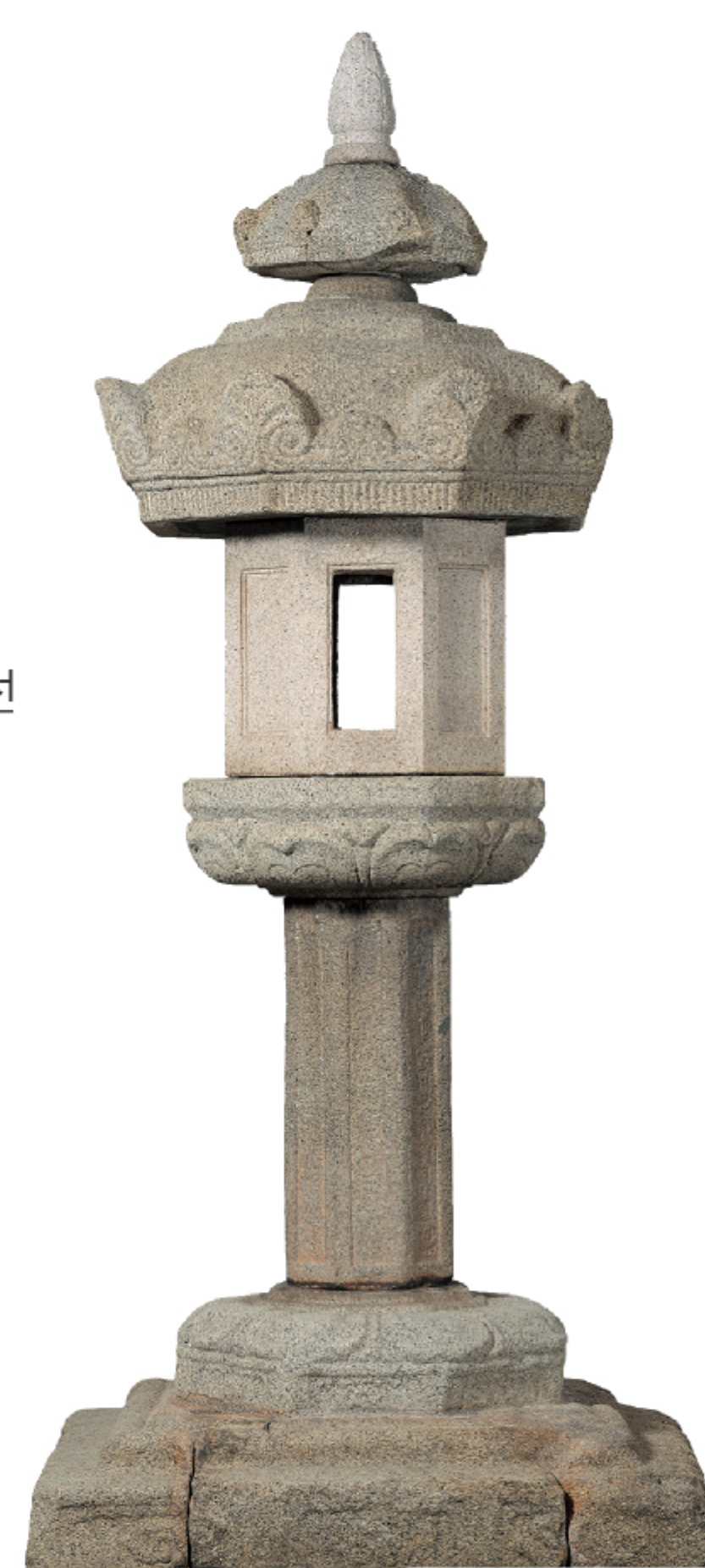
나주 서성문 안 석등 보물 제364호 | 1093년 고려