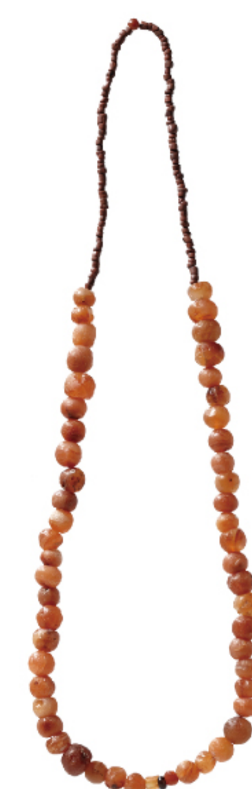
목걸이 보성 거석리 구주 | 마한

고대 한반도에는 기원전 1세기부터 마한(馬韓), 진한(辰韓), 변한(弁韓)의 삼한(三韓)이 있었고, 그 중 경기도·충청도·전라도지역에 자리 잡은 마한이 가장 강성하였습니다. 50여 개의 작은 나라들이 모인 연맹체였던 마한은 그들만의 독자적인 문화를 가지고 있었습니다. 마한 사람들은 가을 추수 후 신에게 제사를 지내며 춤과 노래를 즐겼으며, 구슬을 귀하게 여겼다고 합니다.